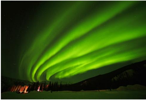
奇納溫泉 與 大油管區