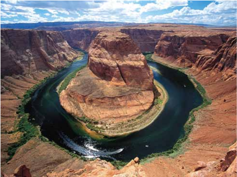
美西 科羅拉多河 大曲道