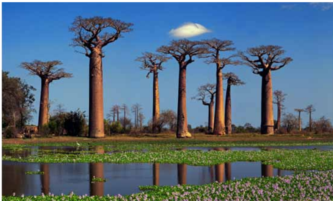
馬達加斯加 猴麵包樹