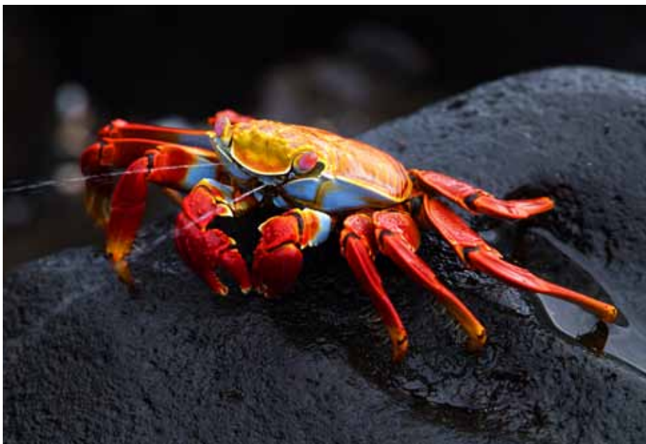
加拉巴哥群島 紅螞噴水