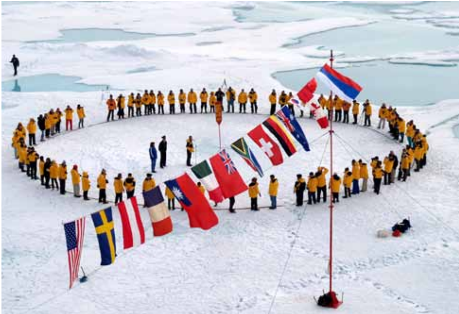
北極九十度（世界之頂）