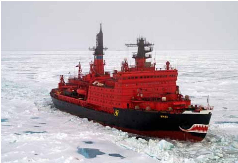
北極 90 度核子動力破冰船