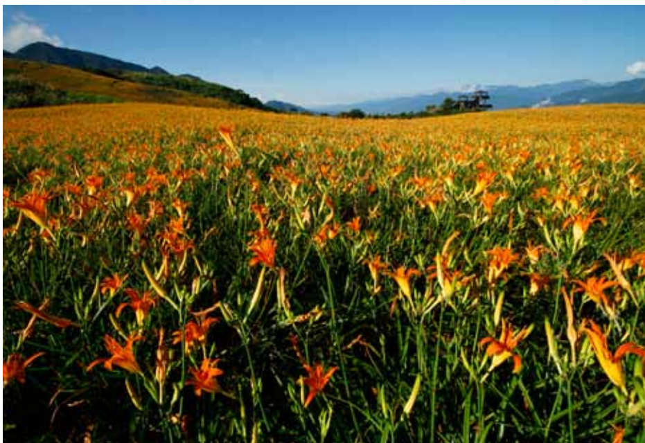
花蓮 富里 六十石山