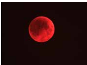
月全食 (2011 年台灣)