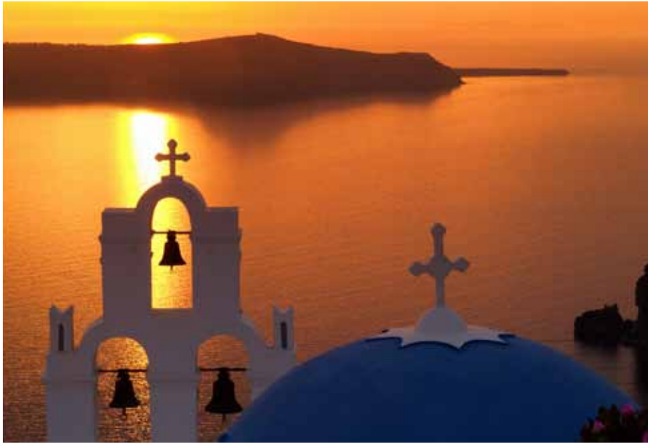
希臘 夕照聖托尼里