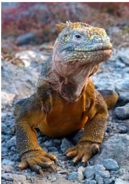
加拉巴哥群島 陸蜥蜴