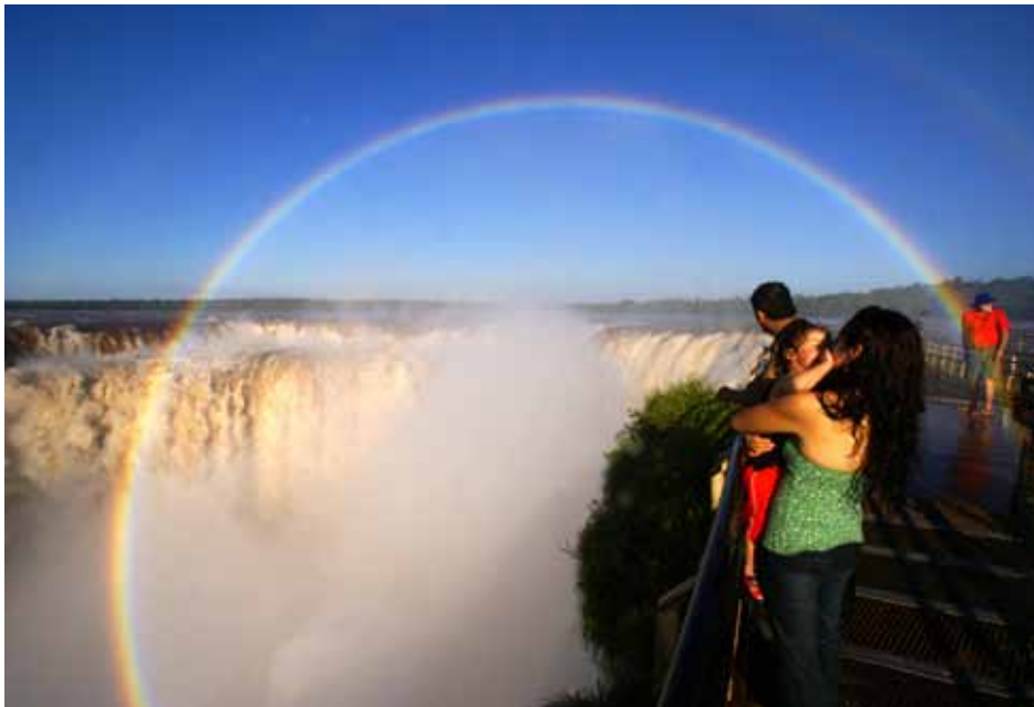
南美 伊瓜蘇瀑布（阿根廷）