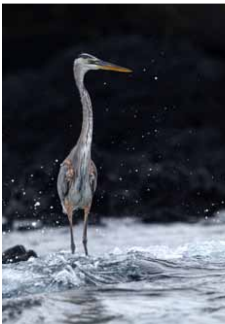
加拉巴哥群島 夜鷺