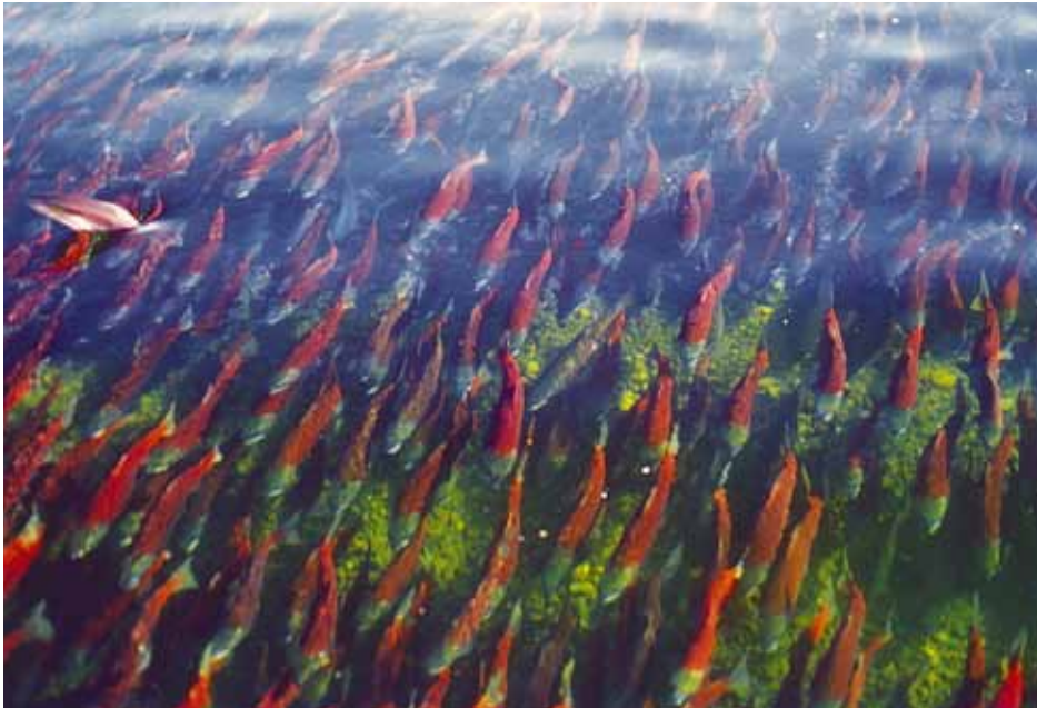
阿拉斯加紅鮭魚 肯邁國家公園