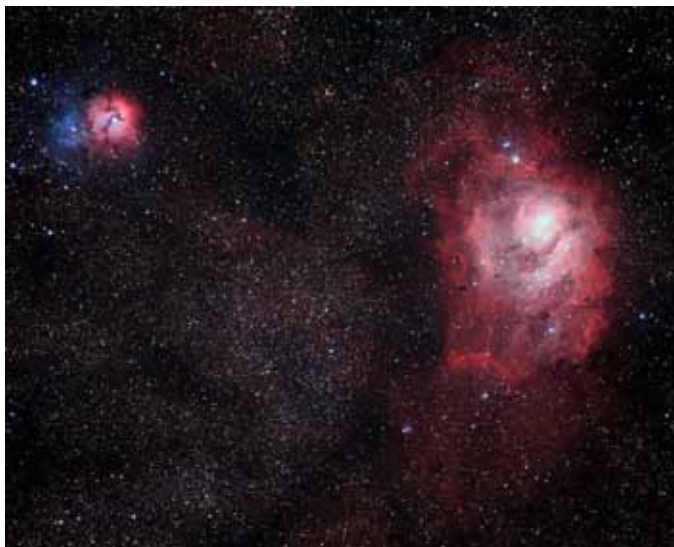
M8 + M20 星雲