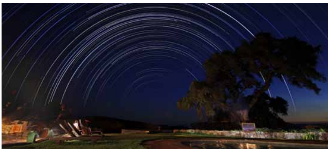
坦尚尼亞 南半球星軌