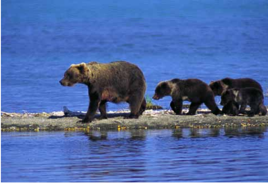
阿拉斯加棕熊 肯邁國家公園