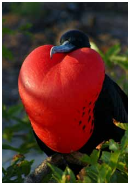
加拉巴哥群島 軍艦鳥