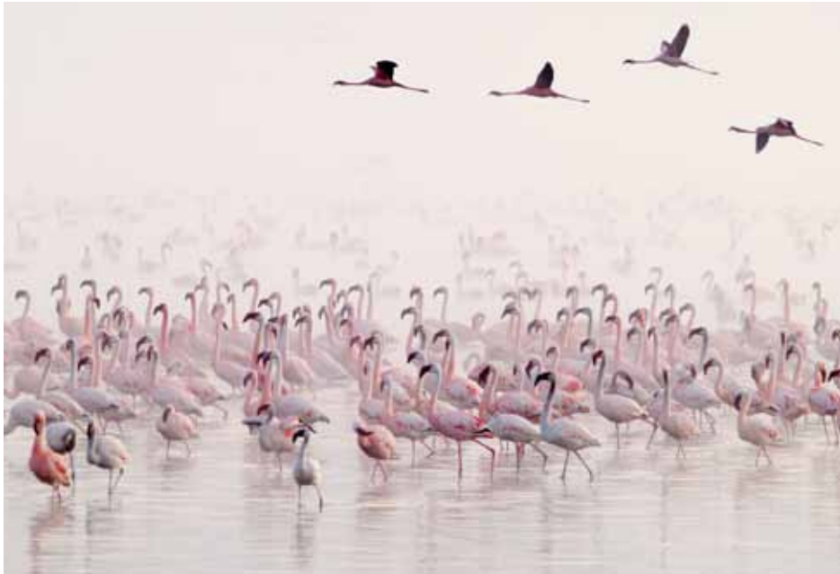
肯亞 晨光序曲 紅鶴