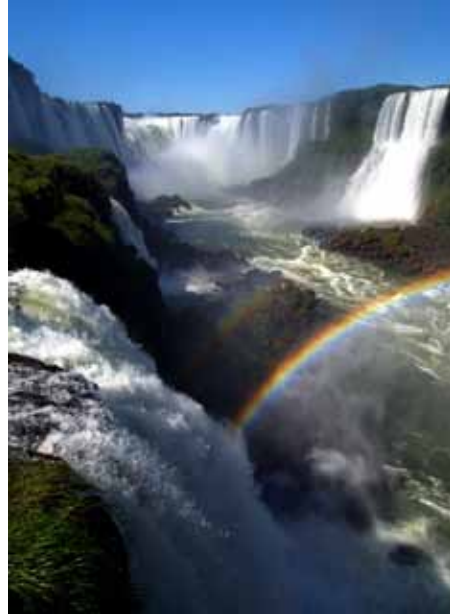
伊瓜蘇瀑布 + 彩虹