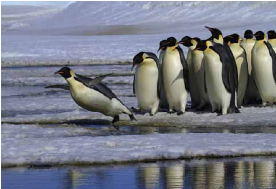
帝王企鵝 等待起飛