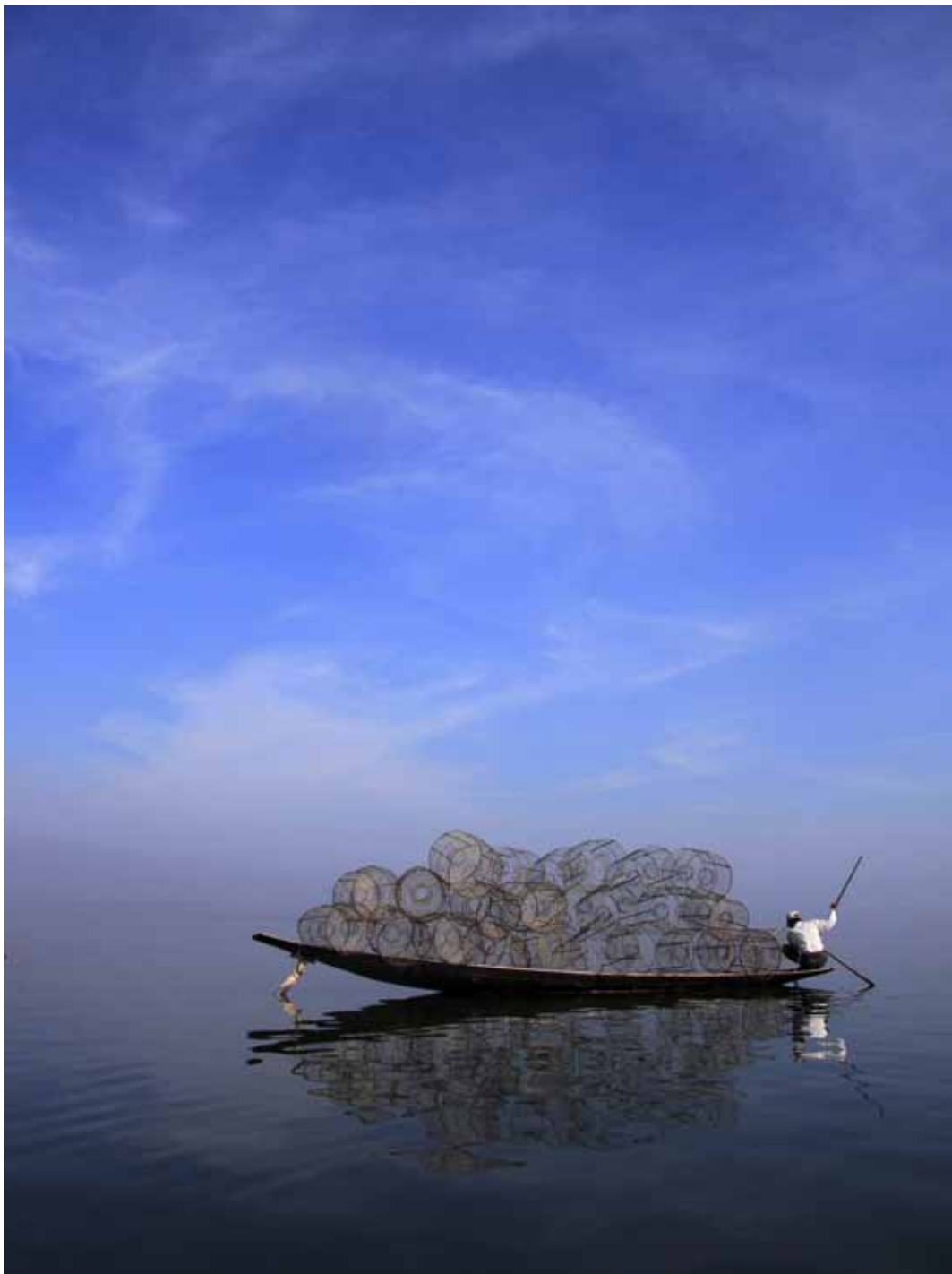
緬甸 恬靜之茵列湖