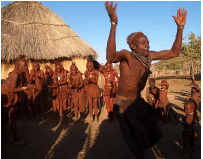
納米比亞 希瑪族土著