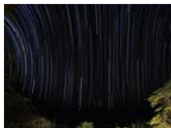
坦尚尼亞 赤道上南北星軌