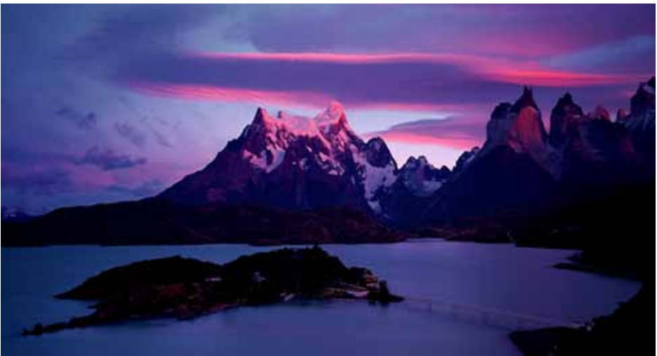
智利 百內國家公園日出