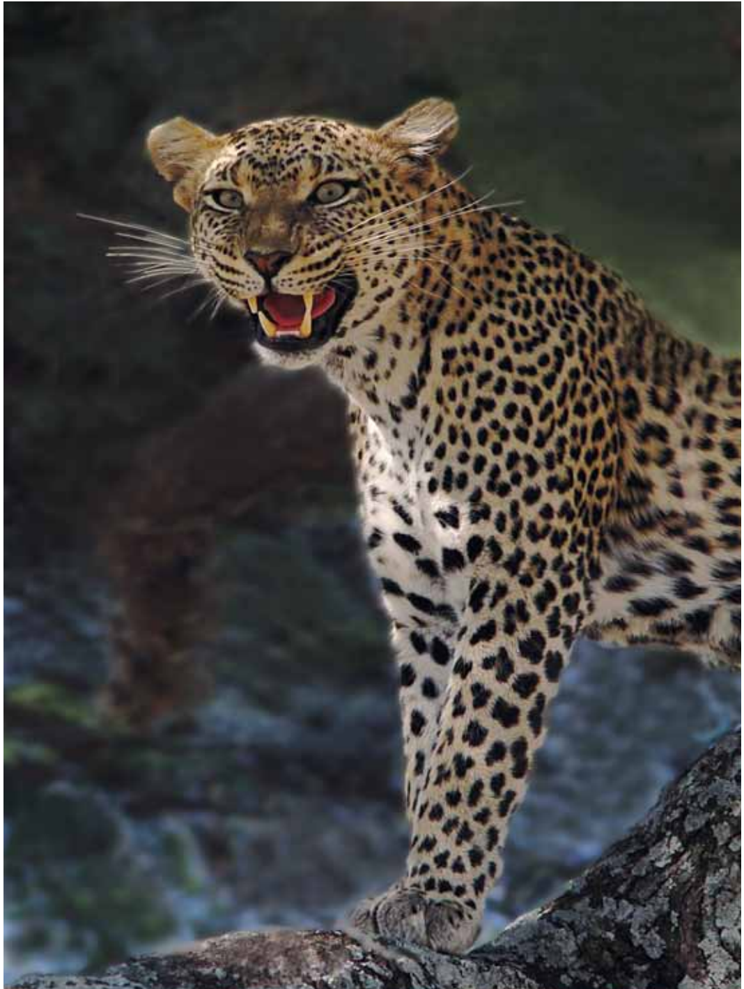
坦尚尼亞 英姿樹豹