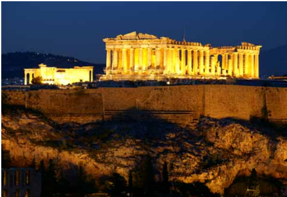
希臘雅典 衛城夜景