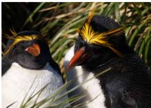
南極 麥可羅尼企鵝