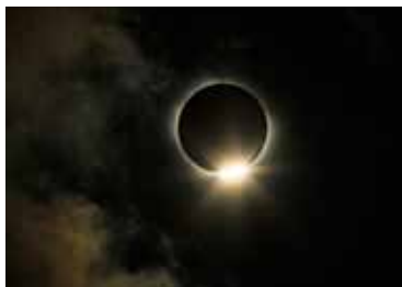
日全食 鑽石環 (2010 大溪地)