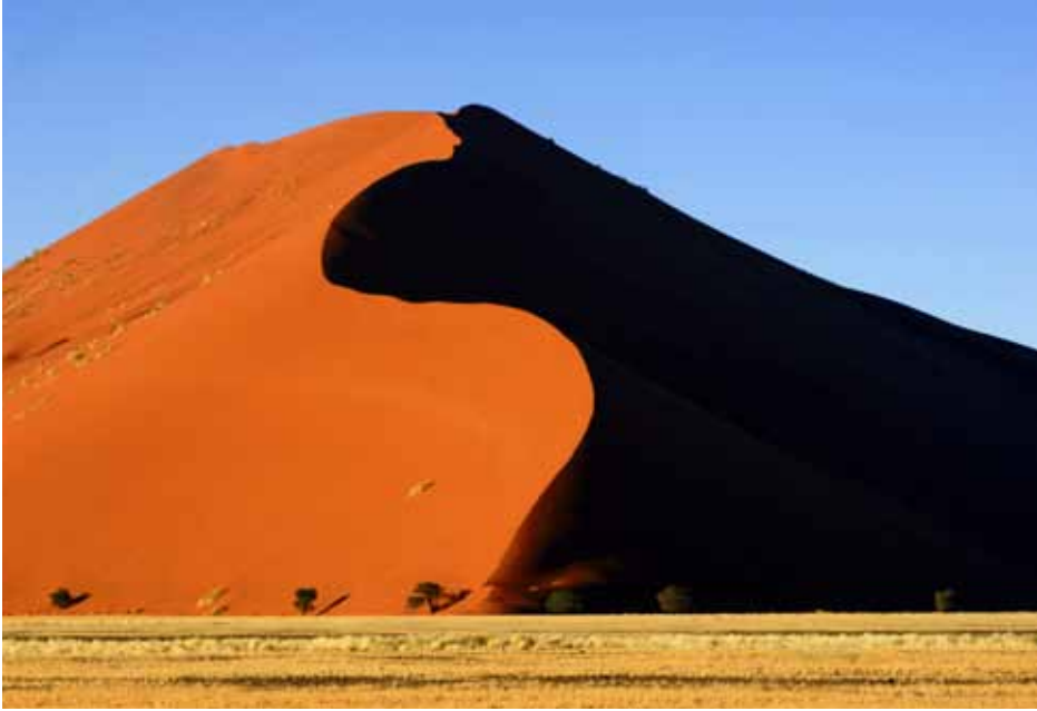
西南非 納米比亞 蘇西里母紅沙丘