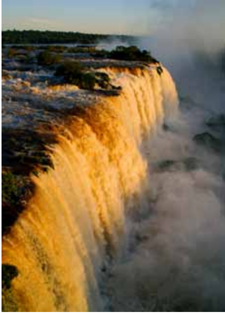
南美 伊瓜蘇瀑布（巴西）