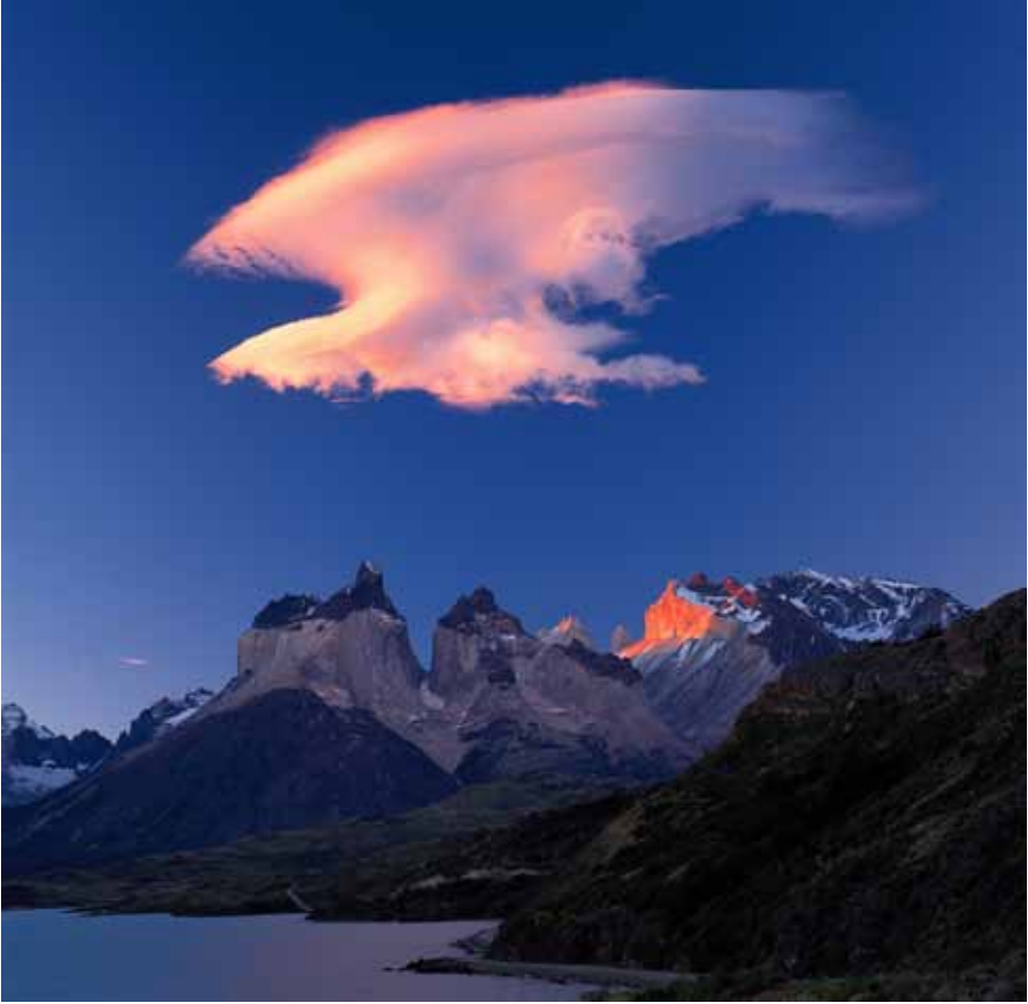
智利 百內國家公園夕照