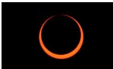
日環食 (2010 年緬甸)