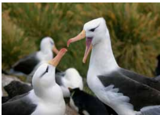
南極 信天翁 南喬治亞島