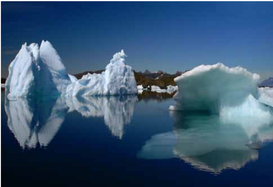
格陵蘭島 冰山一隅